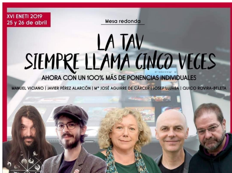
Figura 6: Imagen promocional de una mesa redonda de TAV en el XVI ENETI

Este fenómeno también podría estar relacionado con lo que mencionabas antes sobre la promoción del trabajo. Mientras que los hombres parecen tener más facilidad o disposición para visibilizar su labor, las mujeres a menudo no reciben el mismo nivel de apoyo en términos de visibilidad pública, lo que se traduce en una menor representación en congresos, paneles y mesas redondas.