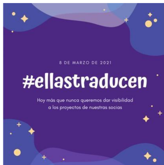
Figura 5: Etiqueta de redes sociales #ellastraducen

Este contraste entre la alta participación femenina en la traducción audiovisual y su menor visibilidad en premios y en la promoción de su trabajo destaca una problemática que aún persiste en el ámbito profesional de la TAV. Aunque el porcentaje de mujeres en el sector es elevado, la brecha en términos de visibilidad y reconocimiento sigue siendo un desafío importante.